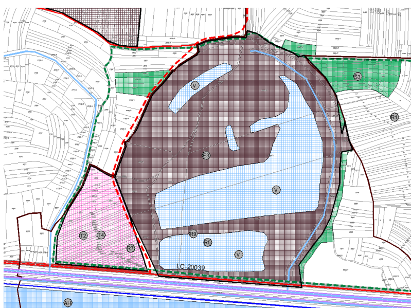
Prikaz 6 EP „Cirkovljan“