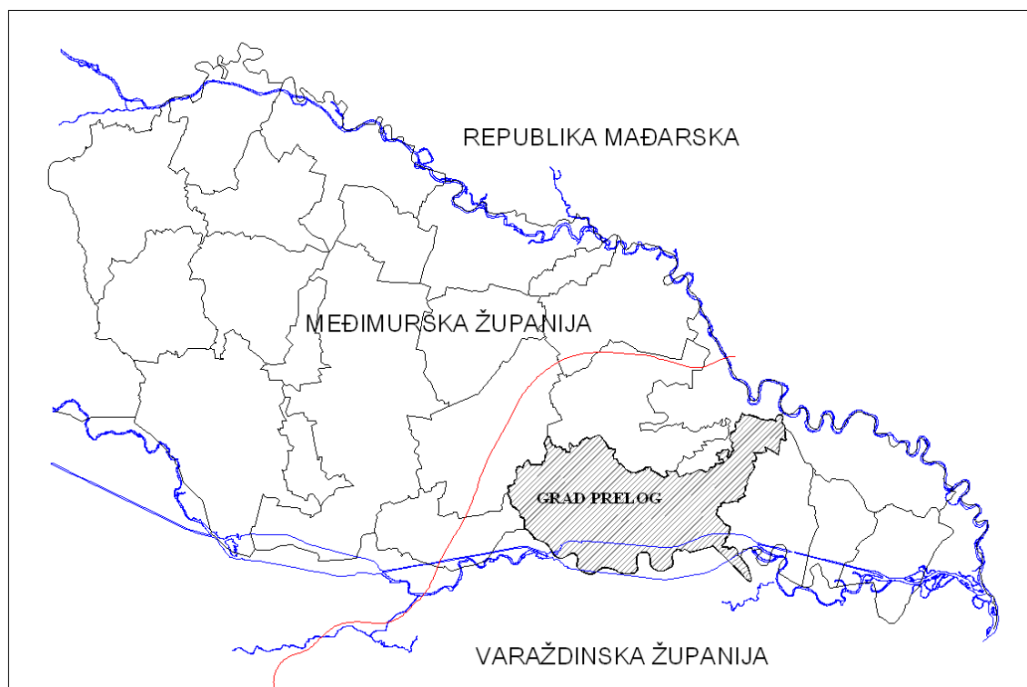
Kartogram 1 Pozicija Grada Preloga unutar Međimurske županije

Područje Grada Preloga prostire se u najvećem dijelu uz rijeku Dravu, a dio Grada, zapravo šumskih i poljoprivrednih površina naselja Draškovec, odvaja se gotovo do rijeke Mure, iako ne izlazi na samu rijeku, već ga od nje dijeli uski pojas od oko 200 m.